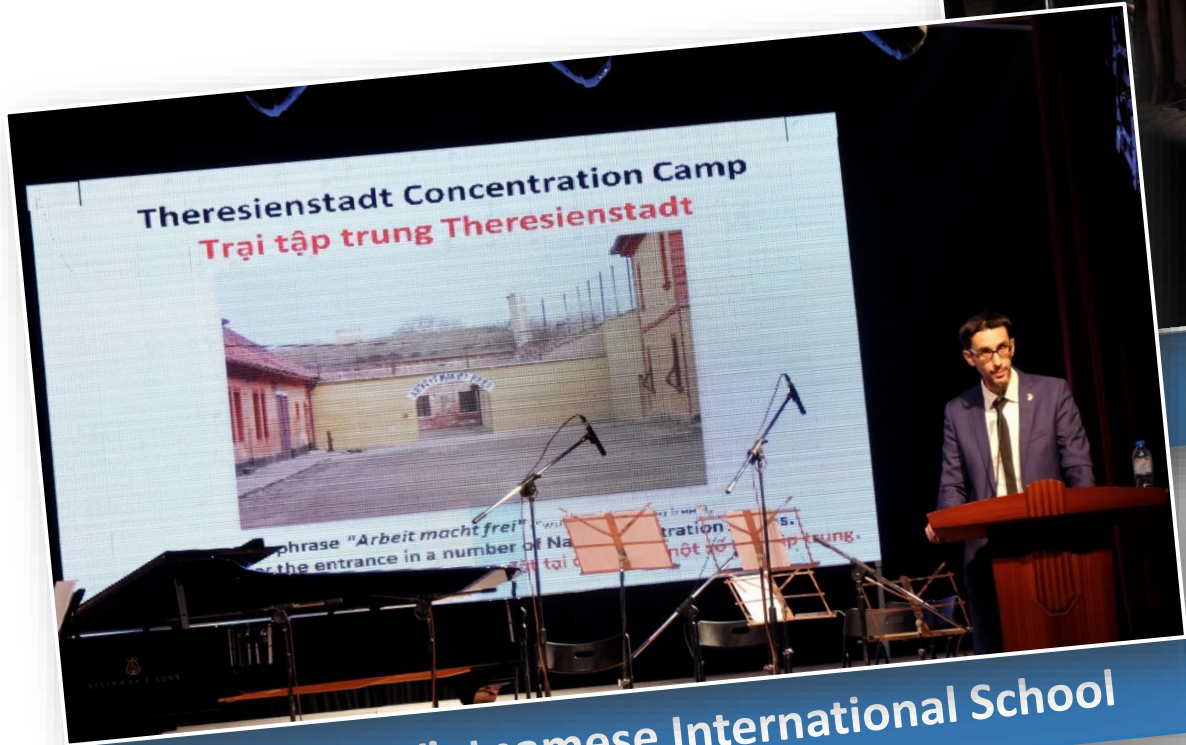
The British Vietnamese International School