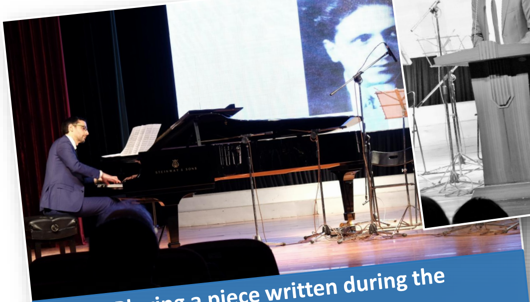
Playing a piece written during the Holocaust for oboe and piano