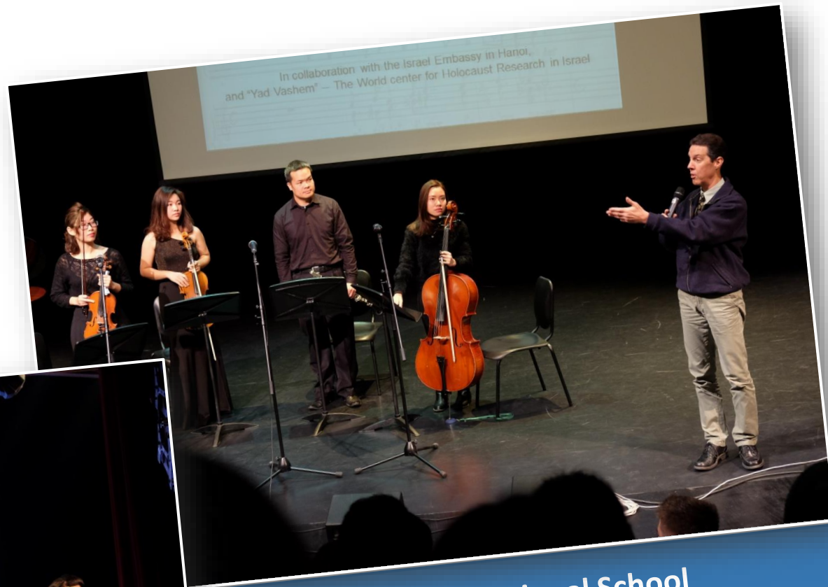
The UN International School